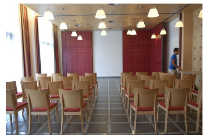
Seminarraum im Erdgeschoss