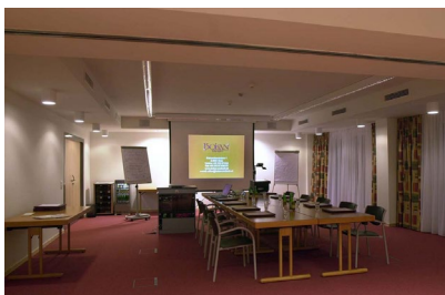
Seminarraum im Untergeschoss