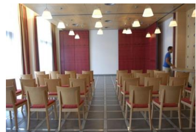
Seminarraum im Erdgeschoss