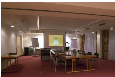
Seminarraum im Untergeschoss